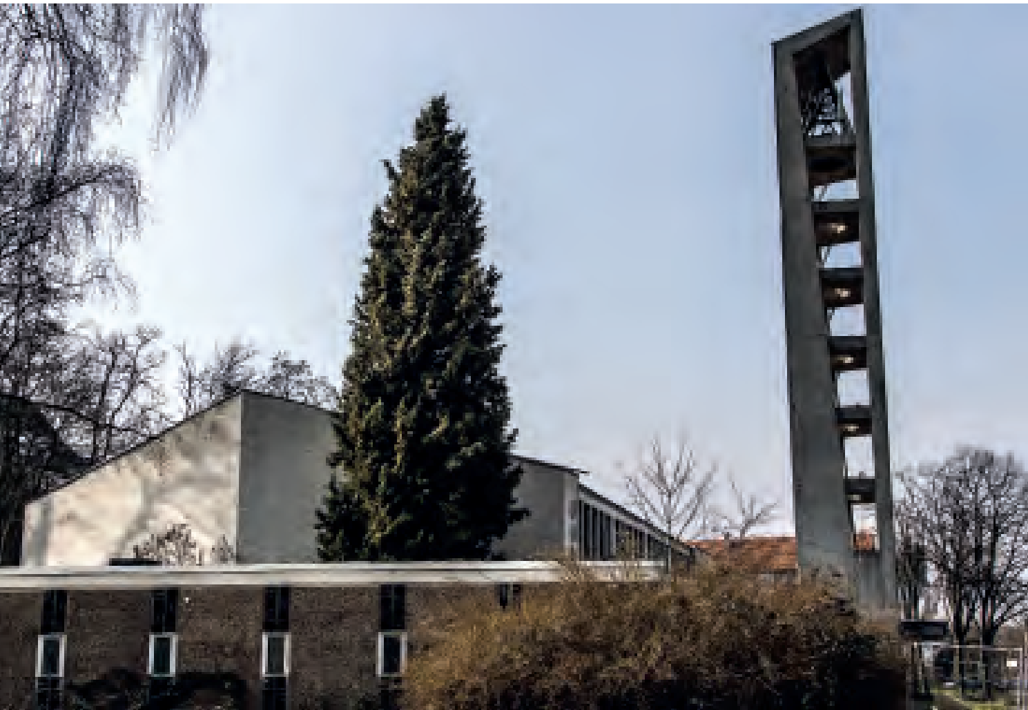
Ansicht von Nordost