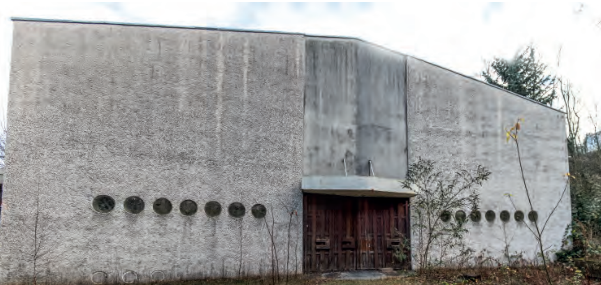
Westfassade der Kirche